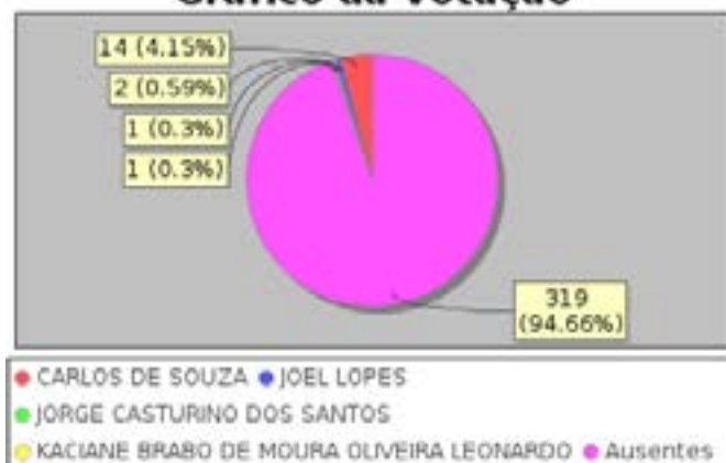
Gráfico da Votação