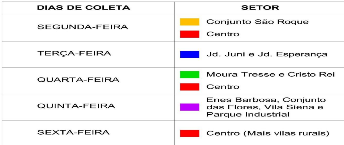
Figura 3: Cronograma previsto da coleta, com legenda colorida de acordo com a Figura 2.

9.2.1 A coleta será realizada na forma descrita na tabela, a seguir: