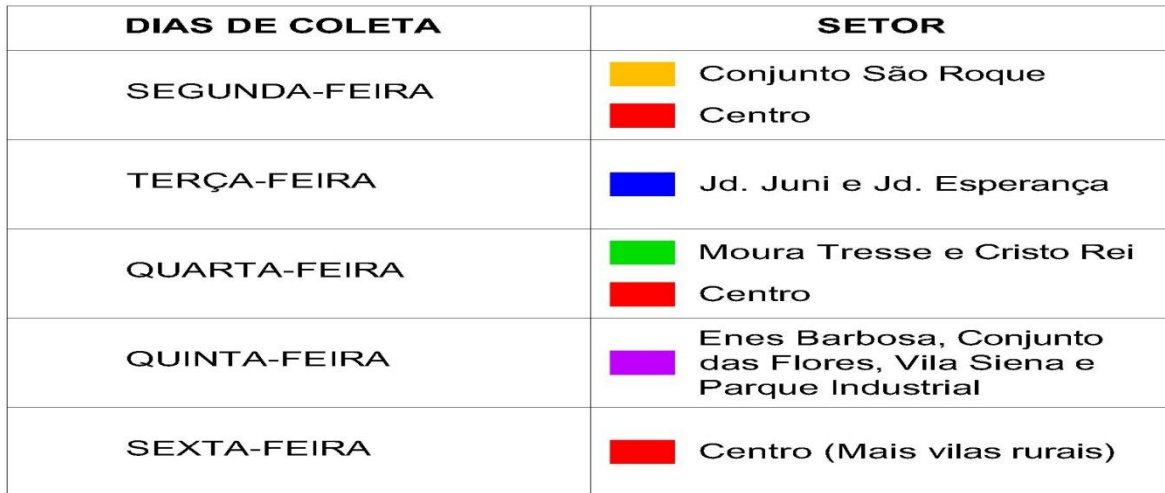
Figura 1: Cronograma previsto da coleta, com legenda colorida de acordo com a Figura 2.

Secretaria de Administração / Diretoria de Licitações